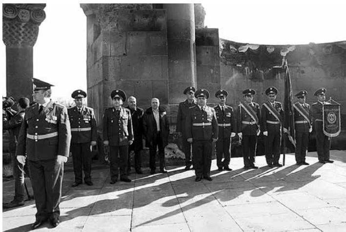
Рис. 2. Присяга новобранцев на территории «Историко-культурного музея-заповедника Звартноц».

ременные ритуалы. Начало положено: на территориях Мемориального комплекса Сардарapatской битвы, историко-культурного музея-заповедника Звартноц проводятся присяги новобранцев (рис. 2). Большой резонанс в обществе произвела попытка проведения свадьбы на территории историко-культурного музея-заповедника Звартноц. Неоднозначное отношение сложилось у общественности из-за упрощенного подхода к делу и антирекламы: просто была предоставлена территория для проведения свадебной церемонии без сопровождающих сценария и комментариев. Организованная специалистами традиционная церемония, исключая неоправданные нововведения, с разъяснениями, театрализованными представлениями, может этнически верно идентифицировать молодое поколение, послужить наглядным пособием для проведения традиционной свадьбы.