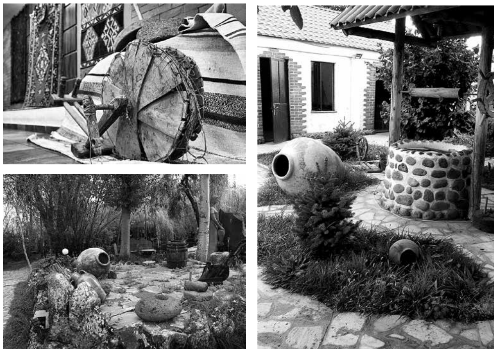
Рис. 1. Фрагменты оформления ресторанных и гостиничных комплексов.

используется не только в традиционных формах музейной деятельности, но и в телевизионных передачах 13 , на передвижных, коммерческих выставках типа Вернисажа в Ереване, при оформлении интерьера ресторанов, кафе, гостиниц и т. д. Предмет культуры превращается в орудие бизнеса, а «музейность» - в инструмент оформления интерьера и способ создания атмосферы. Казалось бы, что в этом плохого? Широкий ассортимент предметов-товаров с национальной окраской на Вернисаже, оформление интерьера ресторанов и гостиниц в национальном стиле привлекает внимание туристов, приносит неплохой доход. Однако, все это нередко делается непрофессионально, без учета истинной интерпретации, значимости предмета, часто идя на поводу у потребителя. Последствием этого является низкое, рассчитанное только на эффект и эмоции, качество предлагаемого продукта: проведение массового театрализованного мероприятия, «выставки» в ресторане, «экспонирование» этнографических артефактов в гостиницах и т. д. (рис. 1-1, 1-2, 1-3). Таковые не всегда удовлетворяют требо-