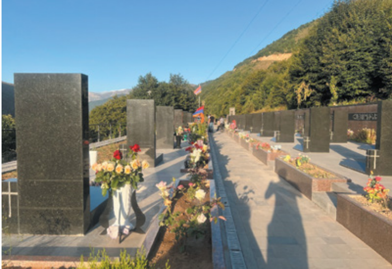
Նկ. 9. 44-օրյա պատերազմի զոհերի զինվորական պանթեոնը Քաջարանում, Սյունիք, 2022 թ.: