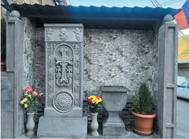
Նկ. 32. 44-օրյա պարերազմի զոհերին նվիրված հուշարձան Քաջարանում, Մյունխբ, 2022 թ.: