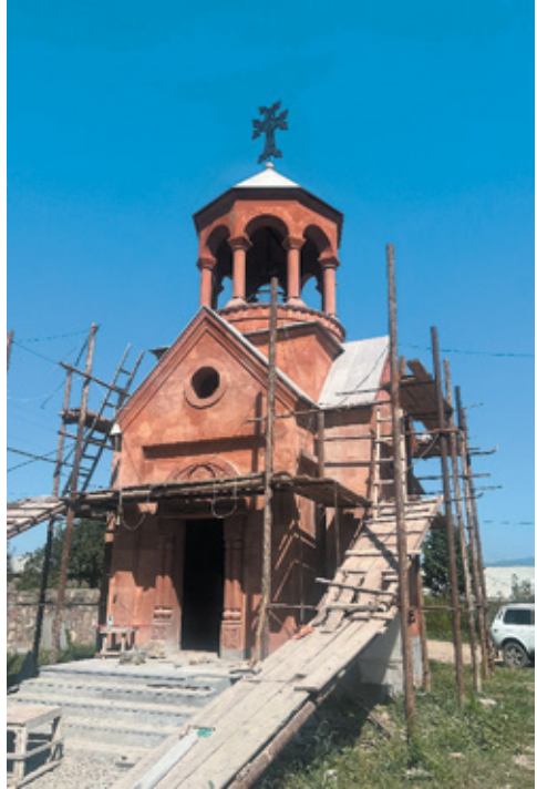
Նկ. 4. Եկեղեցի նվիրված Շ. Գասպարյանի հիշարակին, գ. Աչաջուր, Տավուշ: Լուսանկարը՝ Գ. Աթանեսյանի: