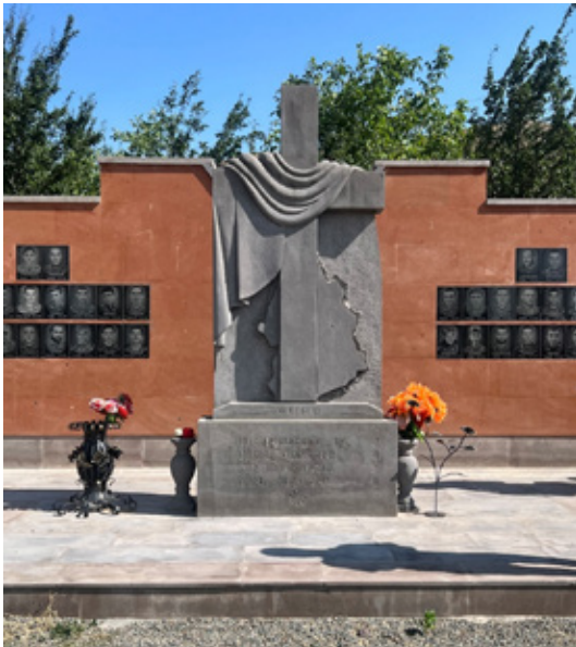
Նկ. 21. Արցախյան պատերազմների զոհերին նվիրված հուշարձան Արին գյուղում, Վայոց ձոր, 2022 թ.: