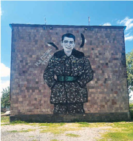
Նկ. 16. 44-օրյա պատերազմի գրաֆիտի, Լանջաղբյուր, Գեղարքունիք, 2023թ.: