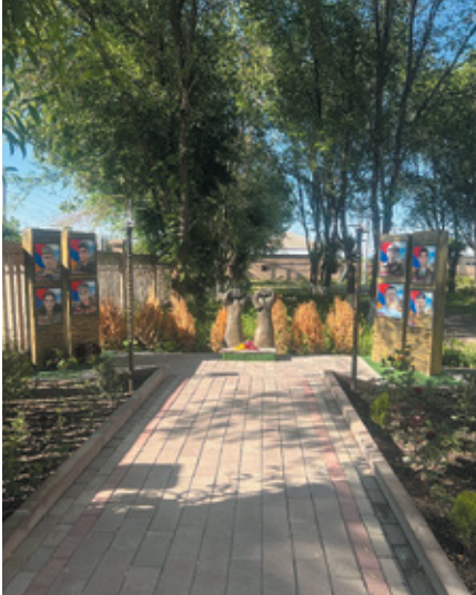
Նկ. 17. 44-օրյա պատերազմի զոհերին նվիրված հուշարձան Մարտունու թիվ մեկ դպրոցի բակում, Գեղարքունիք, 2023 թ.: