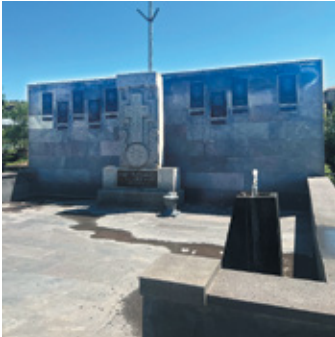
Նկ. 7. Արցախյան ազատամարտի ու 44-օրյա պատերազմի զոհերին նվիրված հուշարձանը Սարիգյուղի հուշահամալիրի փարածքում, Տավուշ, 2022 թ.: