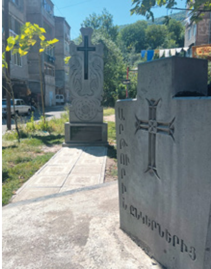
Նկ. 26. 44-օրյա պարերազմի զոհերին նվիրված հուշարձան Գորիսում, Սյունիք, 2023 թ.: