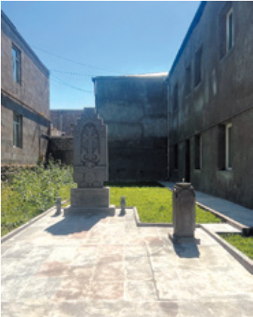
Նկ. 5. Ջոհված երկրապահների հիշարակին նվիրված խաչքար ու հուշաղբյուր, ք. Սիսիան, Սյունիք, 2023 թ.: