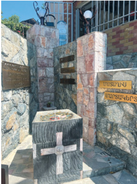
Նկ. 33. 44-օրյա պարերազմի զոհերին նվիրված հուշարձան Դիլիջանում, Տավուշ, 2023 թ.: