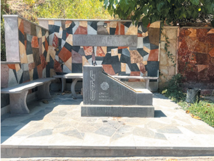
Նկ. 22. Արցախյան պատերազմի անհայրական հուշարձան Արենի գյուղում, Վայոց ձոր, 2022 թ.: