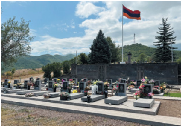
Նկ. 8. Արցախյան ազատամարտի ու 44-օրյա պատերազմի զոհերի զինվորական պանթեոնը Բաղարուրջի հուշահամալիրում, Կասպան, Սյունիք, 2022 թ.: