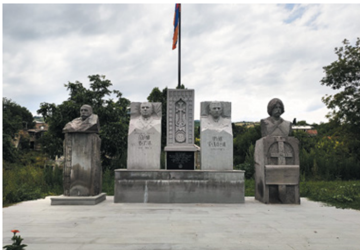
Նկ. 2. 44-օրյա պատերազմում զոհված սերարեցիներին նվիրված հուշարձանը, Վարչախանի ու Սերարեցի Սարդի հուշարձանները, գ. Սերար, Տավուշ, 2022 թ.: