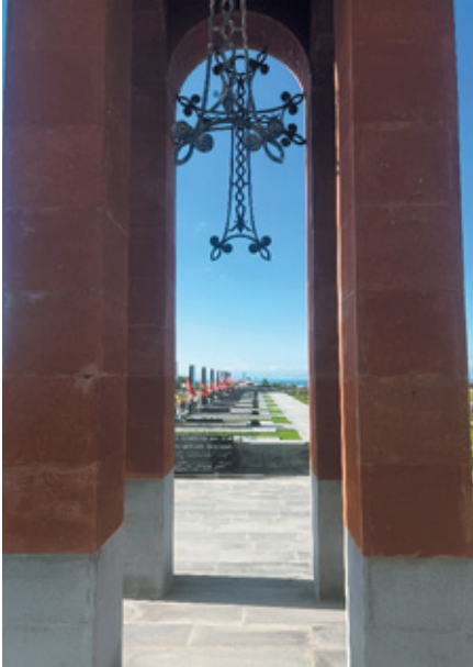
Նկ. 13. 44-օրյա պատերազմի զոհերի հիշարական հավերժացնող հուշարձանն ու զինվորական պանթեոնը Վաղաշեն գյուղում, Գեղարքունիք, 2023 թ.: