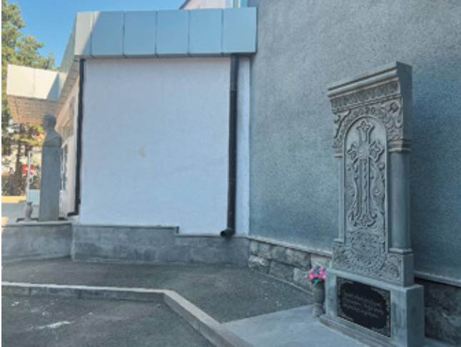
Նկ. 15. 44-օրյա պատերազմի զոհերի հիշատակն հավերժացնող հուշարձանը Գորիսի Ա. Բակունցի անվան դպրոցի բակում, Սյունիք, 2023թ.: