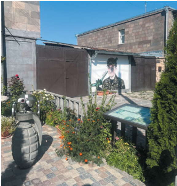
Նկ. 29. 44-օրյա պատերազմի անհաբարական հուշարձան Մխիթանում, Սյունիք, 2023 թ.: