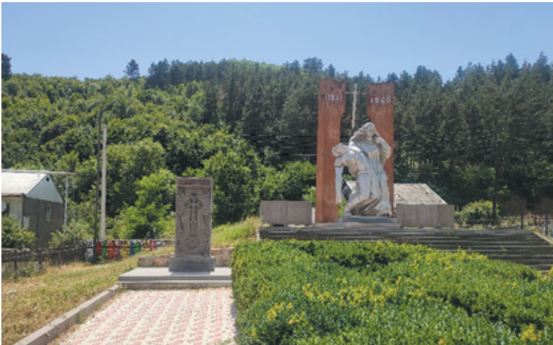
Նկ. 25. 44-օրյա պարերազմի զոհերին նվիրված հուշարձան Հաղարծինի Հայրենական պարերազմի հուշահամալիրի փարսածրում, Տավուշ, 2022 թ.: