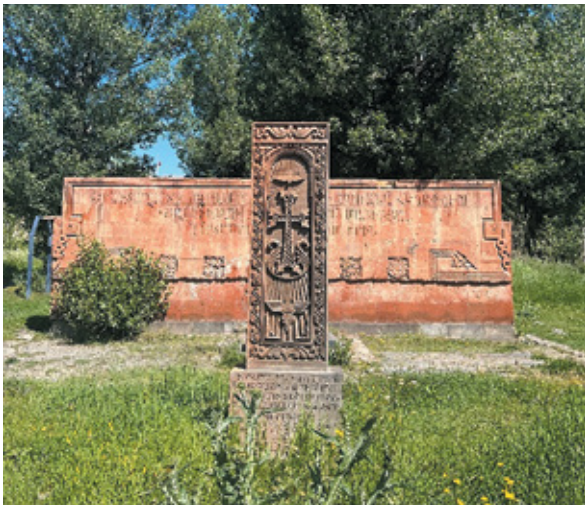
Նկ. 19 Արցախյան ազատամարտի հուշարձանը Գավառի նոր կառուցվող հուշահամալիրում, Գեղարքունիք, 2023 թ.: