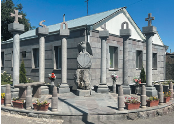
Նկ. 28. 44-օրյա պատերազմի անհաբարական հուշարձան Մխիթանում, Սյունիք, 2023 թ.: