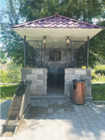
Նկ. 3. Արցախյան ազատամարտում զոհված Գանձակցի հերոս փղաների անմահության պուրակի գրուցարանն ու հուշաղբյուրը, գ. Գանձակ, Գեղարքունիք: