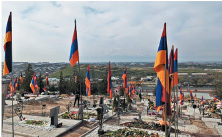
Նկ. 1. Եռաբլուր զինվորական պանթեոնը, ք. Երևան, 2020 թ.: