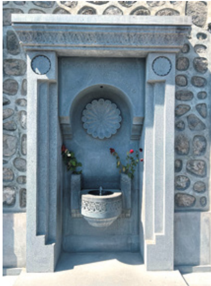
Նկ. 27. 44-օրյա պարերազմի անհատական հուշադրյուր Գորիսում, Սյունիք, 2023 թ.: