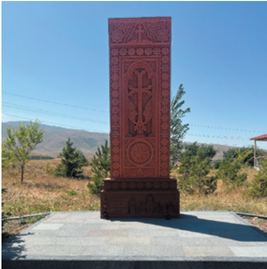
Նկ. 23. Արցախյան երկրորդ պատերազմի զոհերին նվիրված հուշարձան Ջերմուկի եկեղեցու բակում, Վայոց ձոր, 2022 թ.: