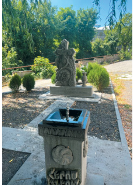
Նկ. 14. 44-օրյա պատերազմի զոհերի հիշարական հավերժացնող հուշարձանն ու հուշադրյուրը դպրոցի բակում, Գորիս Սյունիք, 2023 թ.: