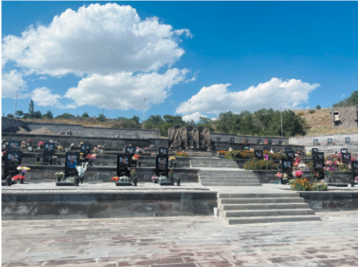
Նկ. 10. Արցախյան ազատամարտի ու 44-օրյա պատերազմի զոհերի զինվորական պանթեոնը Սիսիանում, Սյունիք, 2023 թ.: