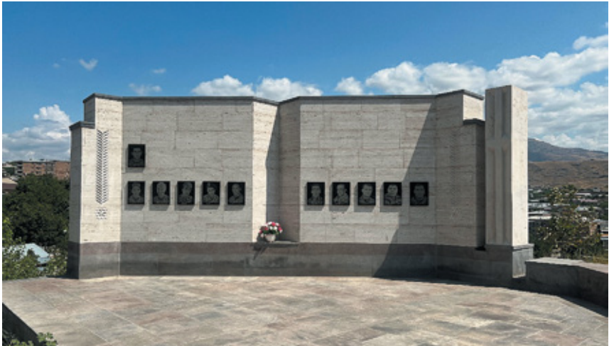
Նկ. 12. 44-օրյա պատերազմի զոհերի հիշարարկն հավերժացնող հուշարձանը Եղեգնաձորի պանթեոնում, Վայոց ձոր, 2022 թ.: