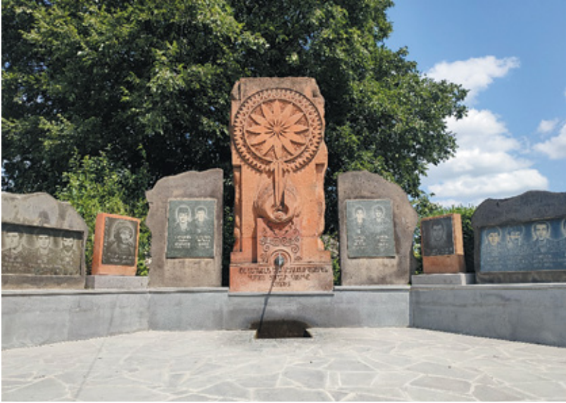
Նկ. 24. Արցախյան պարերազմների զոհերին նվիրված հուշարձան Կիրանցում Տավուշ, 2022 թ.: