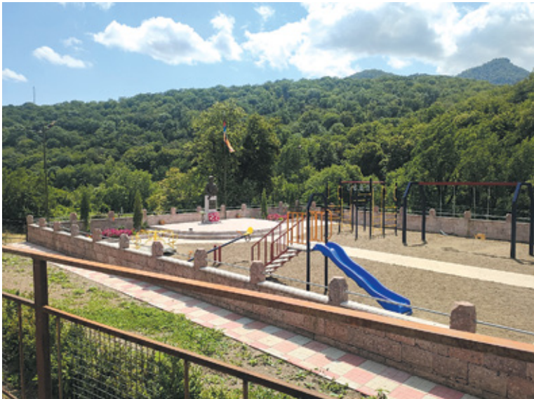
Նկ. 31. 44-օրյա պատերազմի անհայրական հուշարձան խաղահրապարակում, Աճարկուր, Տավուշ, 2022 թ.: