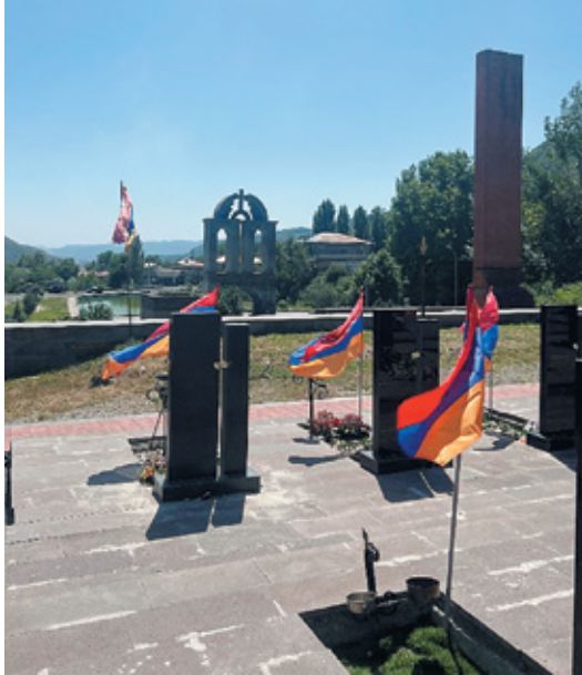
Նկ. 11. 44-օրյա պատերազմի զոհերի զինվորական պանթեոնը Գորիսի հուշահամալիրում, Սյունիք, 2023 թ.: