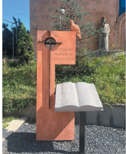
Նկ. 18. 44-օրյա պատերազմի զոհերին նվիրված հուշարձան Դիլիջանի դպրոցի բակում, Տավուշ, 2023 թ.: