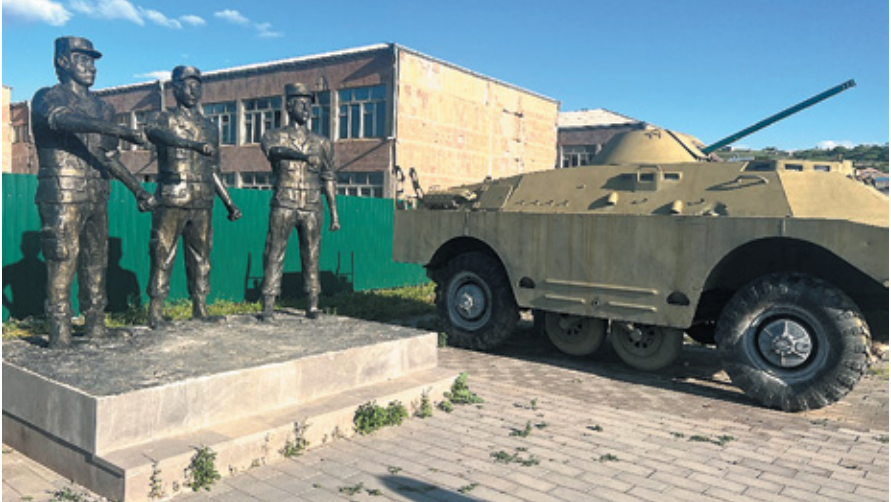
Նկ. 20. Արցախյան պատերազմների զոհերին նվիրված հուշարձանը Վերին Գեղաշենում, Գեղարքունիք, 2023 թ.: