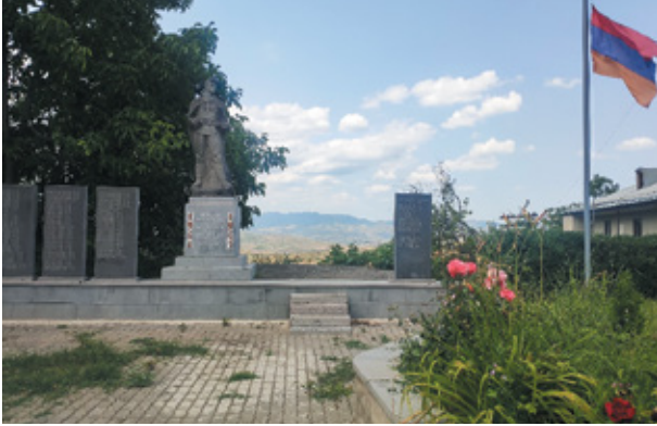
Նկ. 6. Արցախյան ազատամարտի ու 44-օրյա պատերազմի զոհերին նվիրված հուշարձանը Կարմիրգյուղ գյուղում, Գեղարքունիք, 2023 թ.: